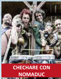
CHECHARE CON NOMADUC