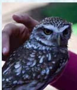
MALEX CLARIANA CETRERÍA y LUDOTECA