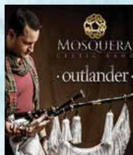
MOSQUERA CELTIC BAND

AGRADECIMIENTO POR SU APRECIADA COLABORACIÓN A: Imprenta Martínez