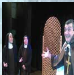
COMPAÑÍA EL RETABLO EN EL ESPEJO